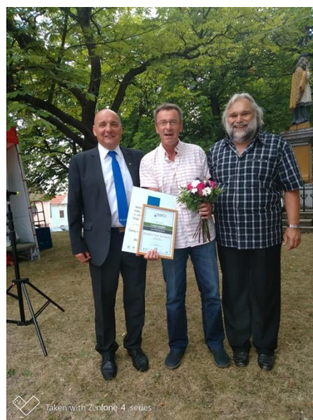
Předávání Krajské Ceny naděje pro živý venkov za rok 2018