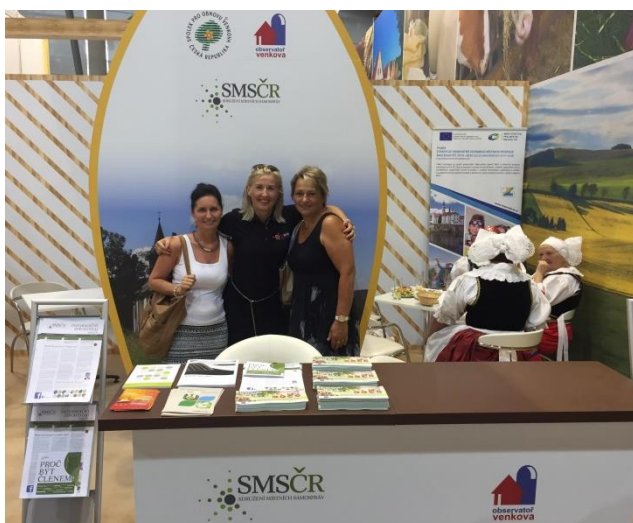
Setkání na Zeměživitelce