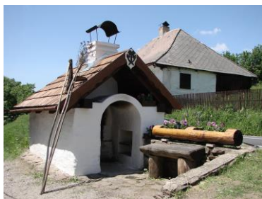
Lenora – obecní pec

Jednou z nejznámějších památek Lenory je veřejná obecní pec na chleba z roku 1837.